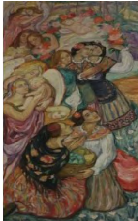
Obra de la pintora de origen ruso Flora Macedonski. Iglesia de Lácara (Montijo)

No es fácil desenvolverse con plena independencia y libertad individual en un entorno rural, donde el machismo y la crítica social de el “qué dirán” sigue imperando, porque, aunque ellas quieran estar por encima de ello, ni sus parejas, ni su entorno se lo permite, pese a su lucha constante, como la madre de un hijo transexual, sola con él (ella ya), acudiendo a citas médicas, porque el padre se avergonzaba de que lo vieran. Lamentablemente, raro ha sido el pueblo en